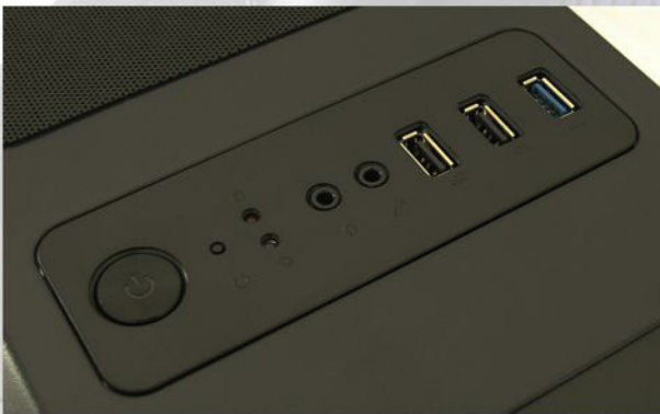
- I/O-Panel mit: 1x USB 3.0-Port, 2x USB 2.0-Port, HD Audio