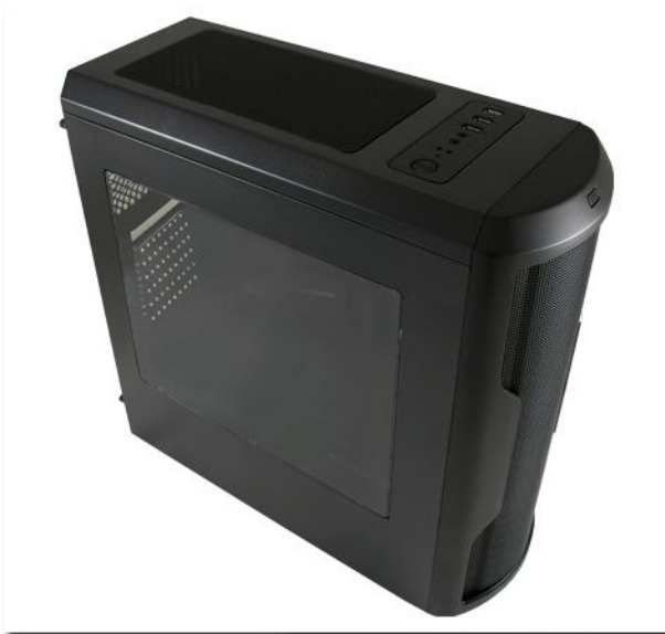
- Seitenteil mit Acrylglas-Fenster