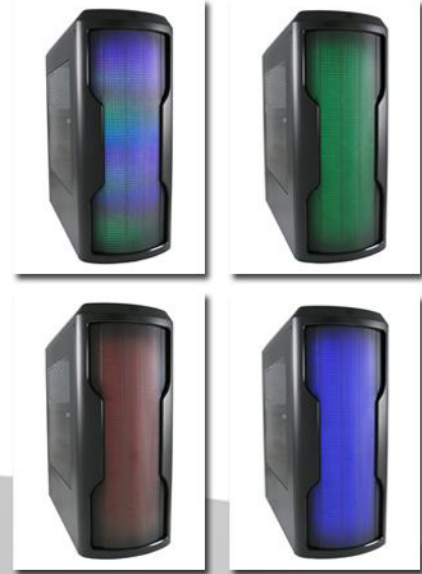
- Multi-LED-Frontpanel mit diversen Farb- und Lichtprogrammen